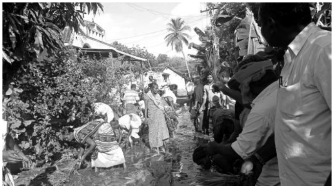
கள்ளக்குறிச்சியில் சாலை வசதி கோரி நாற்று நடும் போராட்டம்