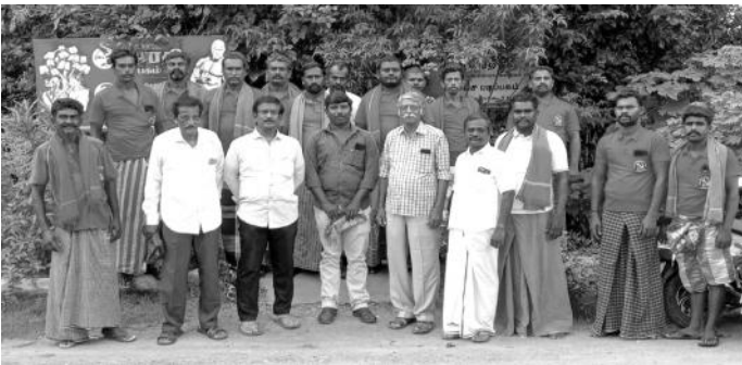
நெல்லையில் புதிதாக இணைந்த சுமைப்பணி தொழிலாளர்கள்