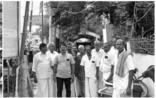
கத்தர்வகோட்டையில் மே நாள் உறுதியேற்பு