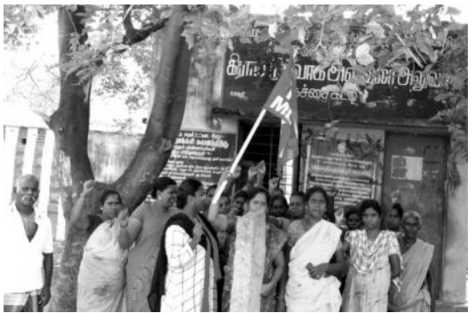
கச்சைகட்டியில் வீட்டு மனை கோரி முற்றுகை