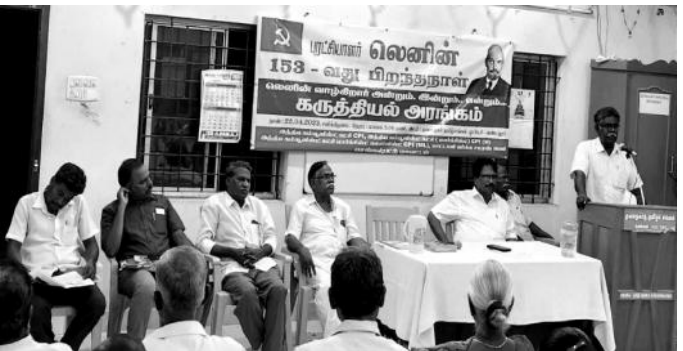
வண்டலூரில் லெனின் பிறந்தநாள் கருத்தியல் அரங்கம்