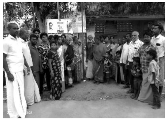
மணப்பாளையில் கட்சி துவக்க நாள் உறுதியேற்பு