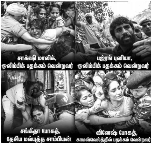
சாக்ஷி மாலிக், பஜ்ரங் புனியா, ஒலிம்பிக் பதக்கம் வென்றவர் ஒலிம்பிக் பதக்கம் வென்றவர்

எனவே, சோழர் செங்கோல், தமிழ், தமிழர் பெருமை பற்றிய பாஜக பரப்புரைகள் அனைத்தும் மோசடிகளே! ஆர்எஸ்எஸ் சதிகள் அம்பலப்படுத்தப் படவேண்டும். □