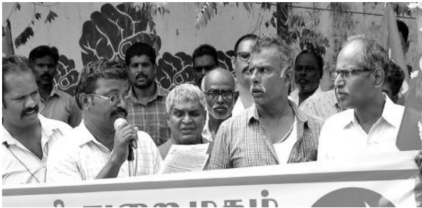
தூத்துக்குடியில் கோரிக்கைகள் மீது கண்டடையர் லாரித் தொழிலாளர்கள் ஆர்ப்பாட்டம்