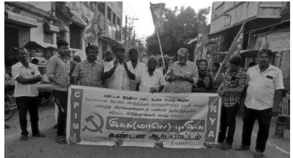
மோடி அரசுக்கு எதிராக நெல்லையில் ஆர்ப்பாட்டம்