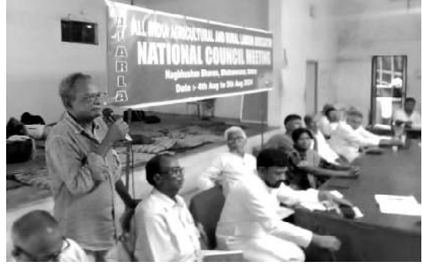
அவிகிதொச தேசிய குழுக் கூட்டம், புவனேஸ்வரம்