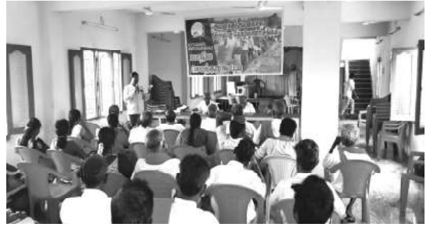
அவிகிதொச மாநில செயற்குழுக் கூட்டம், கந்தவர்க்கோட்டை