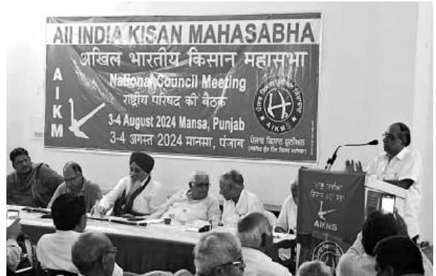
அகில இந்திய விவசாயிகள் மகாசபை தேசியக் கவுன்சில், மான்சா, பஞ்சாப்