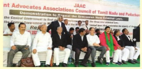
புதிய குற்றவியல் சட்டங்களுக்கு எதிராக... டெல்லியில்