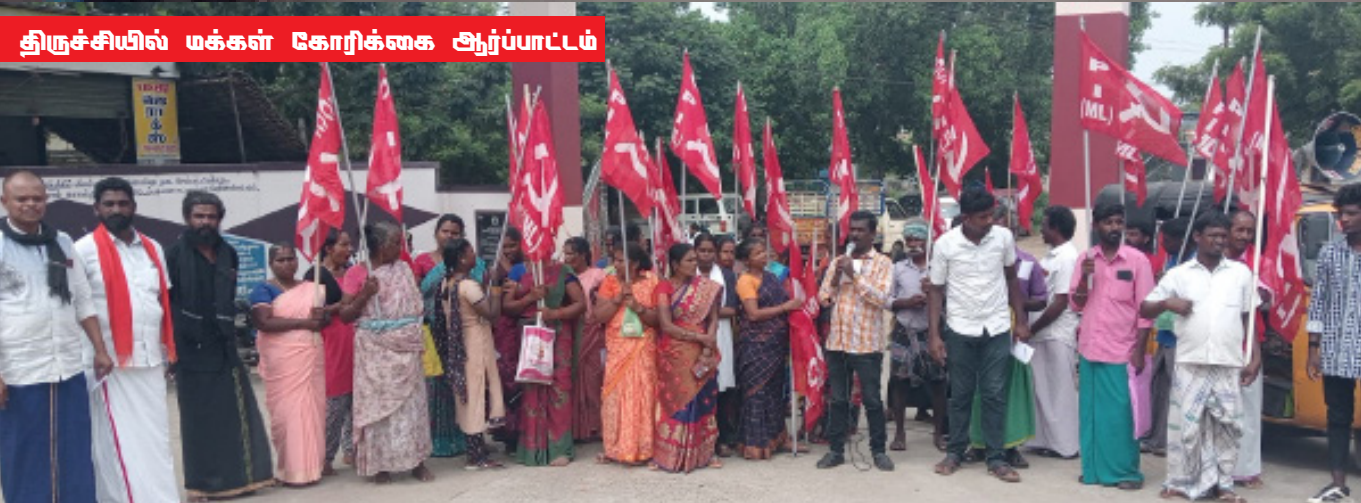
திருச்சியில் மக்கள் கோரிக்கை ஆர்ப்பாட்டம்