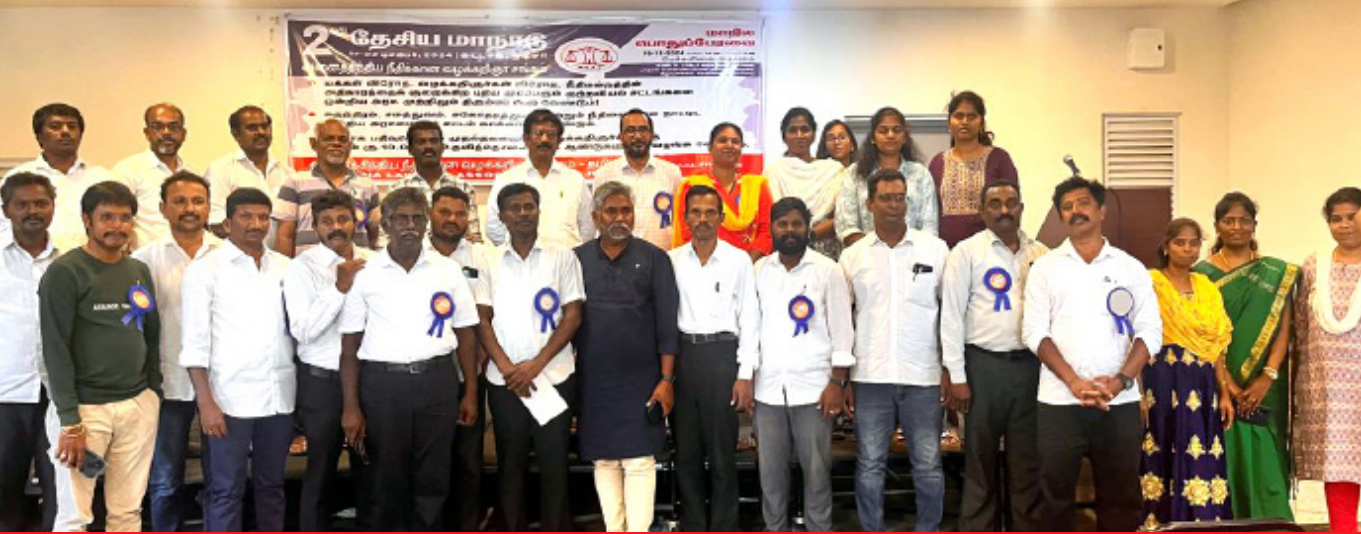
அனைத்திந்திய நீதிக்கான வழக்கறிஞர் சங்கம் (AILA) தமிழ்நாடு மாநில முதல் வாதியப் பேரவை