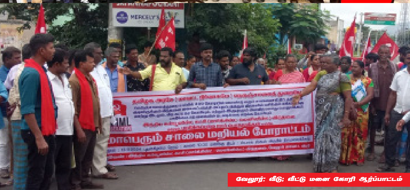
வேலூர்: வீடு, வீட்டு மனை கோரி ஆர்ப்பாட்டம்